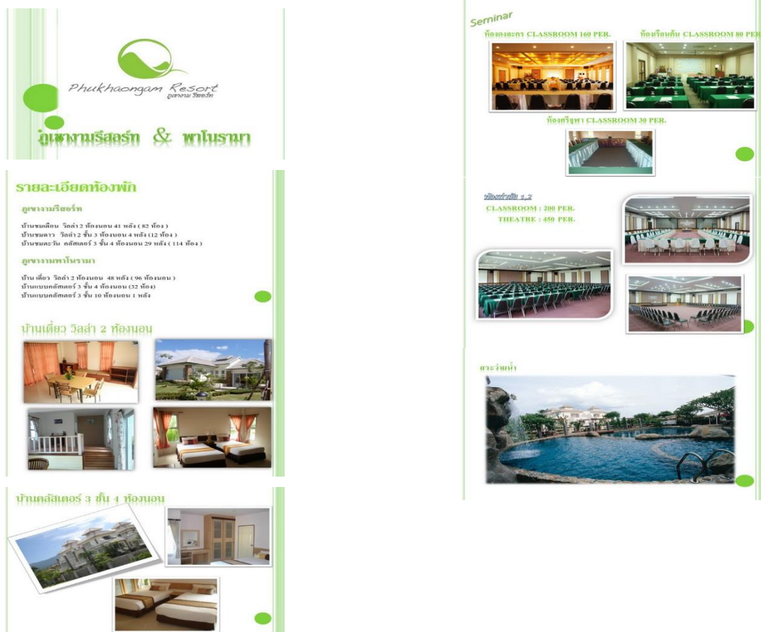
รูปที่ 1 สถานที่จัดงานประชุมวิชาการ 31 st ME-NETT2017

เจ้าหน้าที่สมาคม (ปริदानุช) โทร.08-9223-7117 หรือ 0-2329-8000 ต่อ 2128